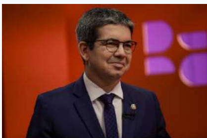
Senador Randolfe Rodrigues é o convidado do DR com Demori