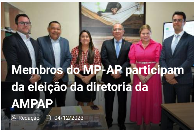
Membros do MP-AP participam da eleição da diretoria da AMPAP